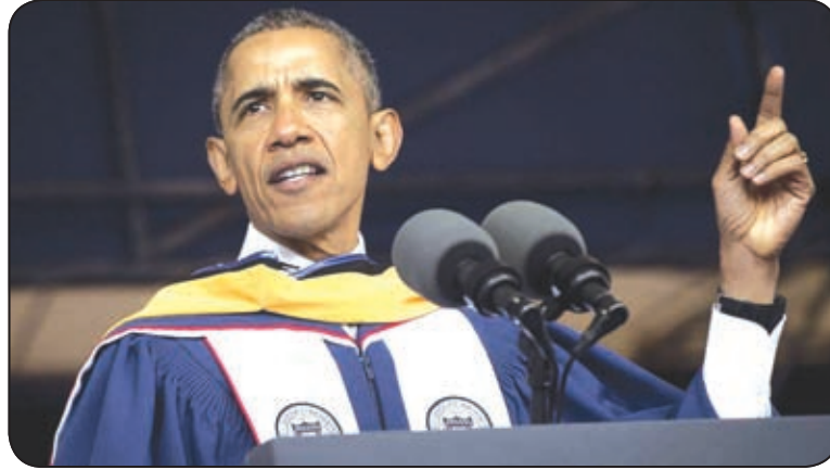
أوباما يلقي محاضرة

أما في التاريخ المعاصر، وإلى جانب الأنشطة الاجتماعية والإنسانية التي كرّس جزءاً من وقته لها، فإن الرئيس الأميركي السابق بيل كليتون جنى مالا