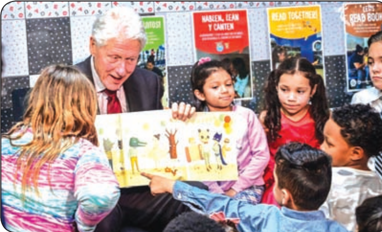
الرئيس الأمريكي السابق بيل كليتون في جلسة قراءة مع الأطفال

لم يتوقّف جونسون عند حد الصحافة المكتوبة، بل أغرته أضواء التلفزيون.