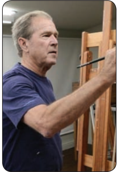
جورج بوش الرسم

وها إن شركة أوباما على موعد جديد مع الجوائز العالمية، إذ إن فيلم «American Symphony»، الذي أنتجته مرشح إلى أوسكار عن فئة أفضل أغنية.