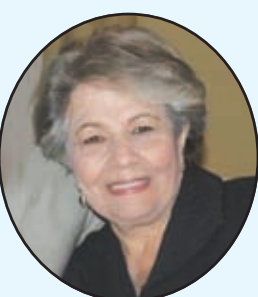
بقلم: سامية خليل ماجستير في التغذية