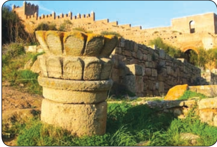
موقع الشالة الأثرية