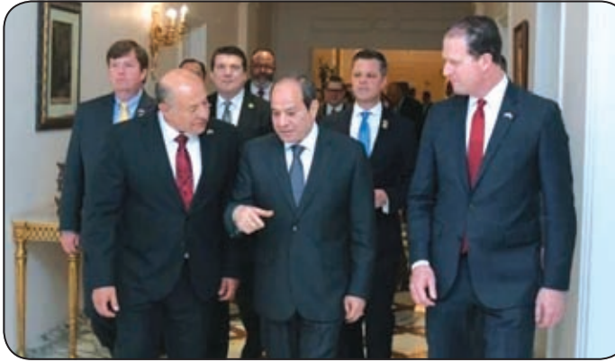
الرئيس السيسي يستقبل الوفد الأمريكي

والاستقرار الإقليمي، مثنين على التنسيق المشترك بين مصر والولايات المتحدة في مختلف المجالات، والذي ينعكس بصورة إيجابية على مصالح الشعبين الصديقين وعلى المنطقة. وقد تناول اللقاء في هذا الصدد