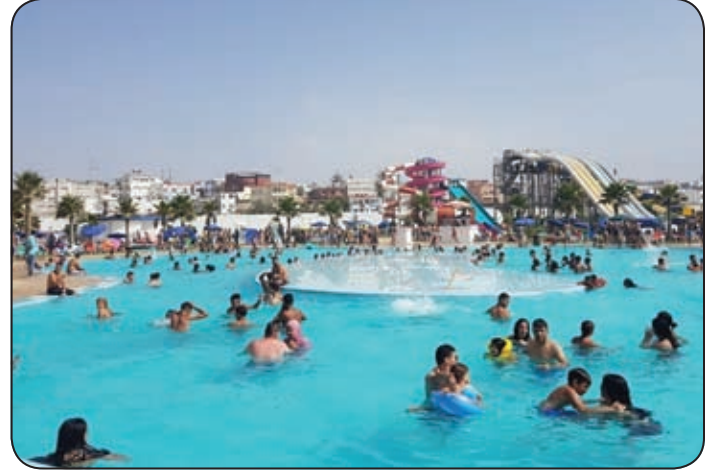
أكوا بايرت الرباط