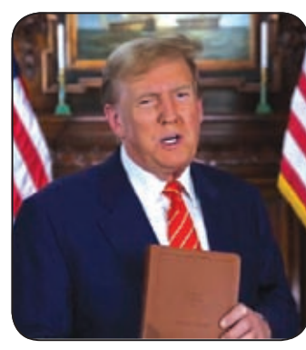
الرئيس السابق ترامب

على نسخة من الكتاب المقدس.. بارك الله في الولايات المتحدة الأمريكية». وتابع «الكثير منكم لم يقرأوها قط ولا يعرف الحريات والحقوق التي تتمتعون بها كأمركيين، وكيف يتم تهديدكم بفقن هذه الحقوق، الدين والمسيحية هما أكبر الأشياء المفقودة في هذا البلد، وأعتقد حقا أننا بحاجة إلى إعادتهما وعلينا إعادتهما بسرعة». ويتضمن كتاب «بارك الله في الولايات المتحدة الأمريكية»، دستور الولايات المتحدة، والتعديلات التي تشكل وثيقة الحقوق، وإعلان الاستقلال، وتعهد الولاء، وجوقة مكتوبة بخط اليد «بارك الله الولايات المتحدة الأمريكية». وحصل الموقع التجاري لبيع الكتاب المقدس على ترخيص استخدام صورة ترامب من شركة «سي أي سي فينتشرز د.م.»، وهي ذاتها التي تمتلك العلامة التجارية لمجموعة الأحذية الرياضية التي أطلقها، في فبراير الماضي.