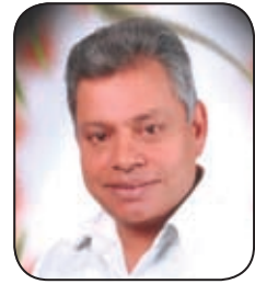
إعداد: ماهر هنري

وتعتبر من الحدائق المائية الترفيهية الفريدة من نوعها حيث تشكل مساحة مثالية للترفيه سواء للكبار أو للصغار. تضم الحديقة أنواع عديدة من