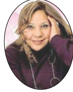
إعداد: مريم عادل