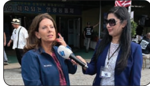
سيناتور متقاعدة «ميليسيا ميلينديز»