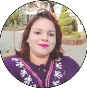
إعداد: ماري بسما