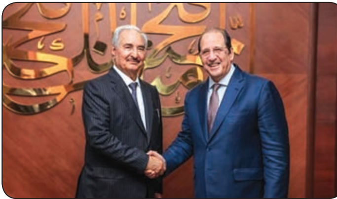
خليفة حفتر يلتقي اللواء عباس كامل

المتحدة في ليبيا.. هذا وأكد رئيس جهاز المخابرات العامة المصرية على «دعم مصر لكل الخطوات الرامية لإجراء الانتخابات الرئاسية والبرلمانية المتزامنة وصولا لمرحلة الاستقرار الدائم، مشيدا بدور القيادة العامة للقوات