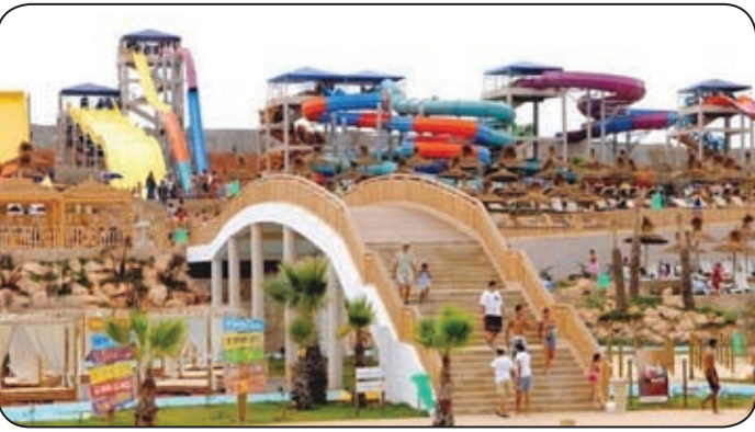
حديقة الإيسيسكو الدار البيضاء